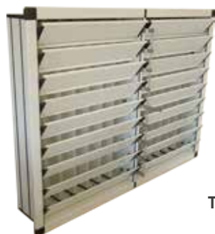
Trappe de pignon

Maîtrisez efficacement les circuits d'air !