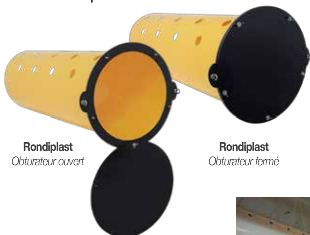
Rondiplast Obturbateur ouvert