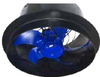
Ventilateur ECblue intégrable en cheminée