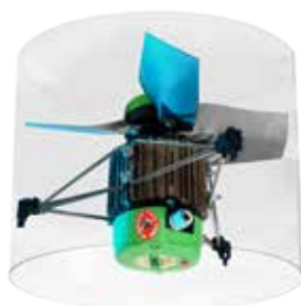
Ventilateur EMI CE Plus intégrable en cheminée