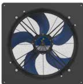
Ventilateur ECblue sur cadre

Photos non contractuelles et données susceptibles de modification.