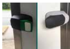
Verrou avec ouverture intérieure et extérieure