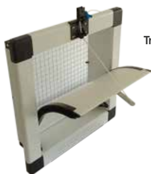
Trappe à volets courbés