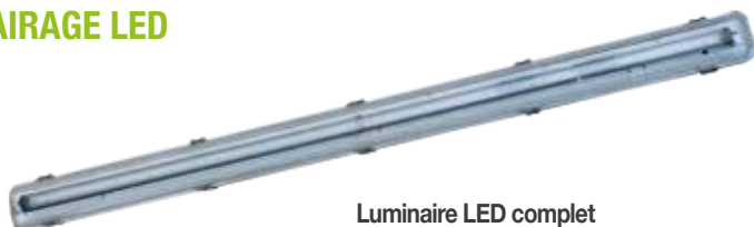
Luminaire LED complet