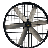
▶ Brasseur OURAGAN 55