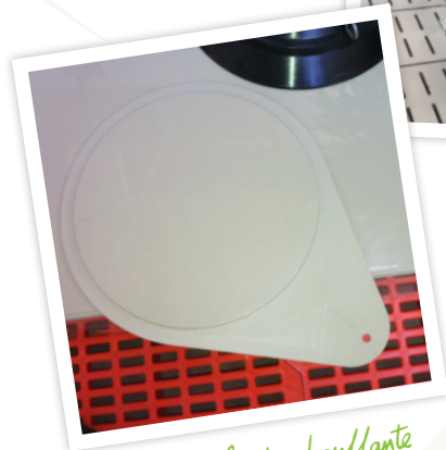
Trappe lampe chauffante