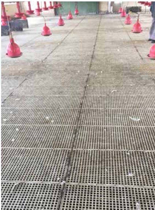
Après départ des canards