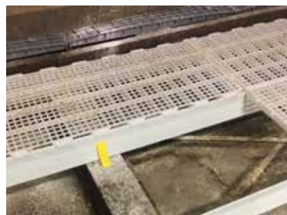
Au début du montage