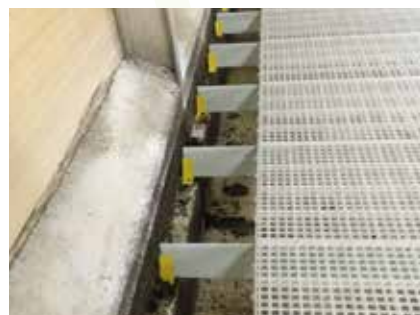
Pendant le montage