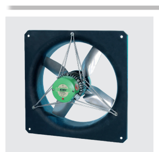
Ventilateur EMI sur cadre